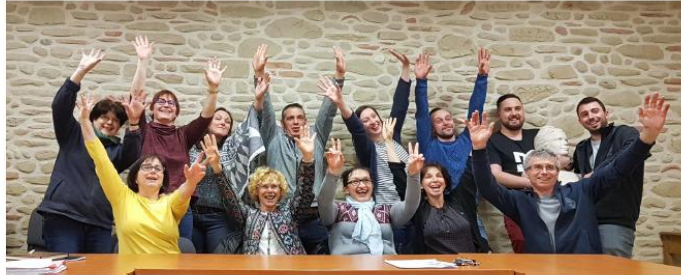
L'équipe dynamique du Comité des Fêtes vous attend nombreux !