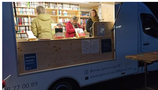
●●● Un camion, des livres, un café... le petit monde de Léa sur les marchés !

Pour développer son projet, Léa a bénéficié du programme Pépite oZer qui accompagne les étudiants et jeunes diplômés dans leur création d'activité.