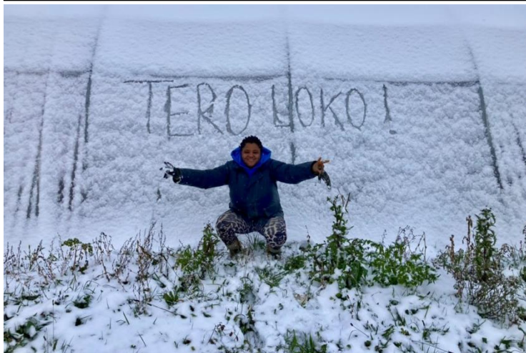
●●● La neige, une bonne nouvelle pour les cultures !