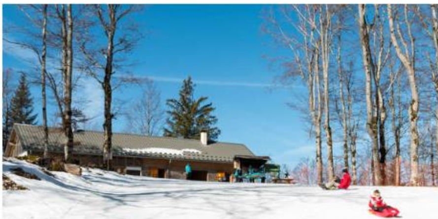
●●● Bâtiment d'accueil côté Patente, accessible depuis Presles et Mallevall, avec salle hors sac

La station des Coulmes est gérée par la Communauté de communes Saint Marcellin Vercors Isère. Station familiale, située à proximité de notre village (entre ½ heure et 40 minutes), elle permet d'aller découvrir les joies de la neige à un coût très raisonnable.