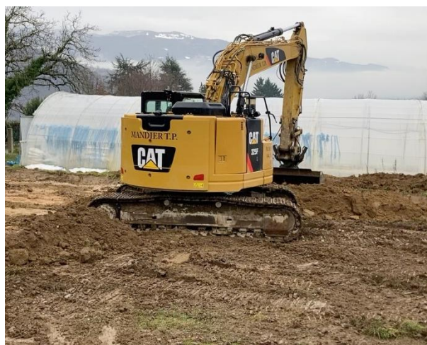
●●● L'entreprise Mandier a démarré le terrassement