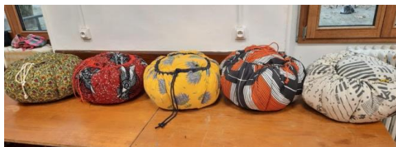
●●● La production de marmites de l'atelier d'octobre