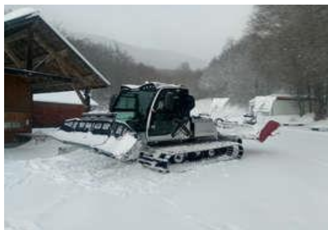
●●● La dameuse du domaine des Coulmes, devant le bâtiment d'accueil côté Belvédère

Toutes les infos actualisées (enneigement, ouverture/plan des pistes, état des routes, tarifs, etc...) sont à retrouver sur le site coulmes-vercors.com