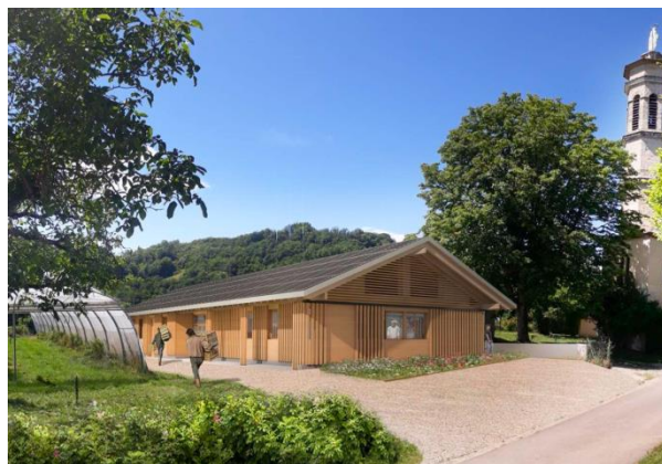
●●● Vue d'architecte du futur bâtiment