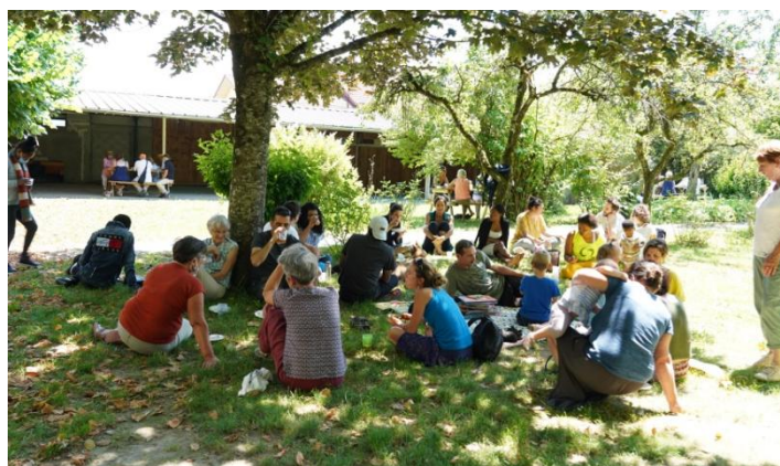
••• Une journée bénévoles en 2020 au Jardin de Bon Rencontre