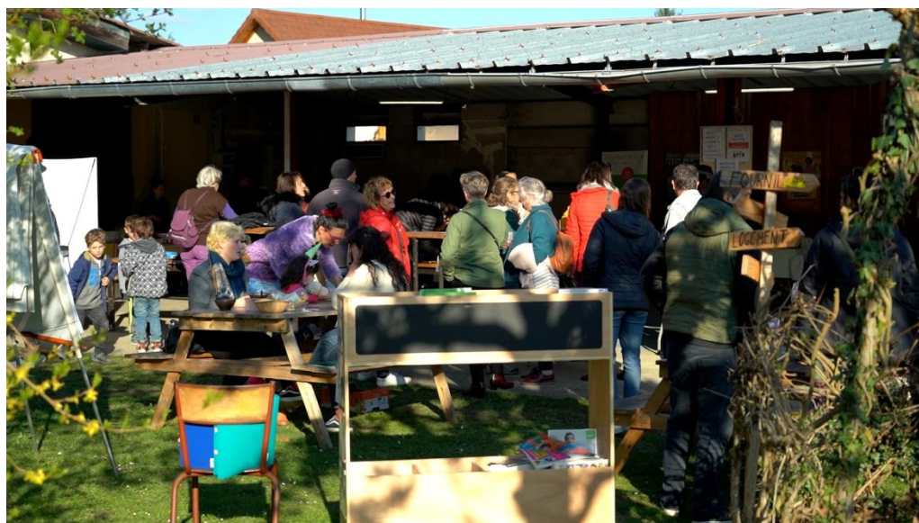
••• Les grands marchés regroupent une dizaine d'exposants, tous les premiers mardis du mois. Ils s'accompagnent généralement d'une buvette et parfois, d'animations. Ce mois-ci, le grand marché aura lieu le 7 mai.